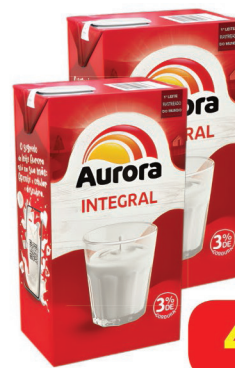
Leite Longa Vida Aurora TP 1 Litro