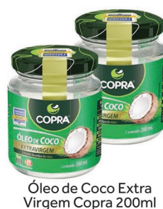
Óleo de Coco Extra Virgem Copra 200ml