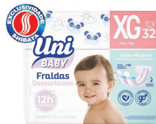
Fralda Descartável Uni Baby P.48 / M.42 / G.36 / XG.32 / XXG.30