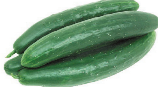
Pepino Japonês kg