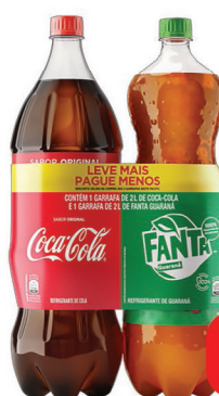
Refrigerante Coca-Cola Pet 2 Litros + Fanta Guaraná Pet 2 Litros Leve + Pague -