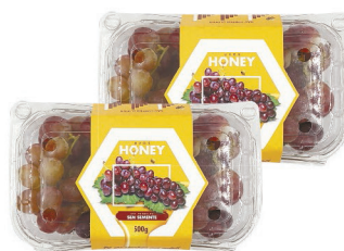
Uva Vermelha s/ Semente Honey Bandeira - 500g