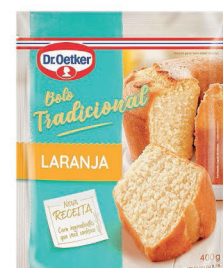
Mistura p/ Bolo Tradicional Dr. Oetker Sachê 400g (Exceto Formigueiro / Chocolate / Confeitos)