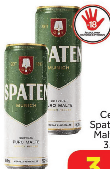
Cerveja Spaten Puro Malte Lata 350ml