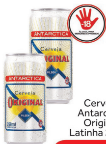
Cerveja Antarctica Original Latinha 269ml