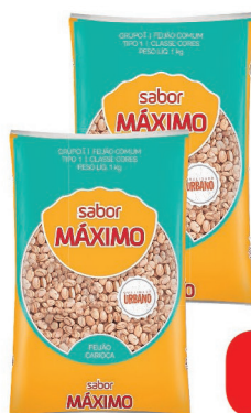
Feijão Carioca Máximo Pacote 1kg