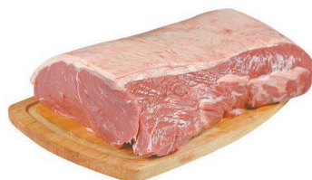
Contra Filé Bovino Porcionado kg (Exceto Montana Steakhouse / Maturatta)

SEXTA 19/04 | SÁBADO 20/04 | DOMINGO 21/04