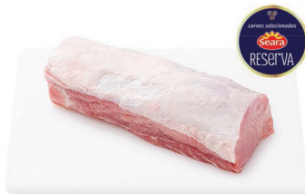
Lombo Suíno Seara Reserva kg