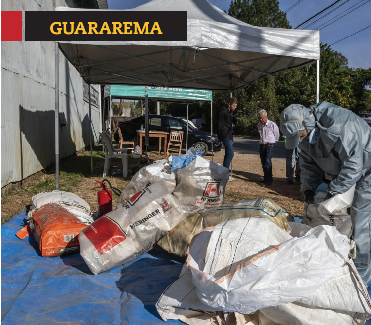
» Prefeitura incentiva descarte correto de embalagens de agrotóxicos. Cidades, página 3