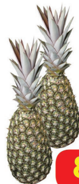
Abacaxi Pérola unid.