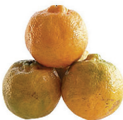
Ponkan - kg