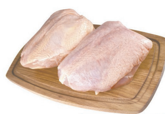
Peito de Frango c/ Osso Resfriado kg