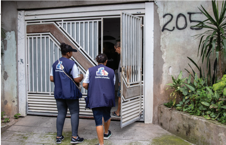
Cidade registra aumento de casos, com 1.755 até agora, e alta nos atendimentos. Cidades, página 4