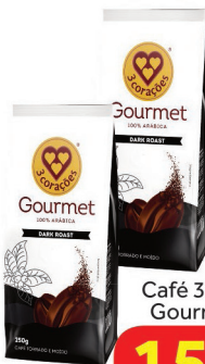
Café 3 Corações Gourmet 250g