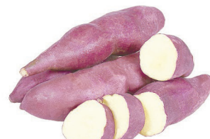
Batata Doce Rosada kg