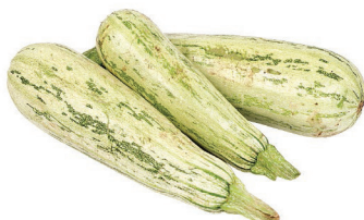
Abobrinha Italiana kg