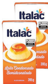
Leite Condensado Semidesnatado Italac TP 395g (Exceto Zero Lactose)