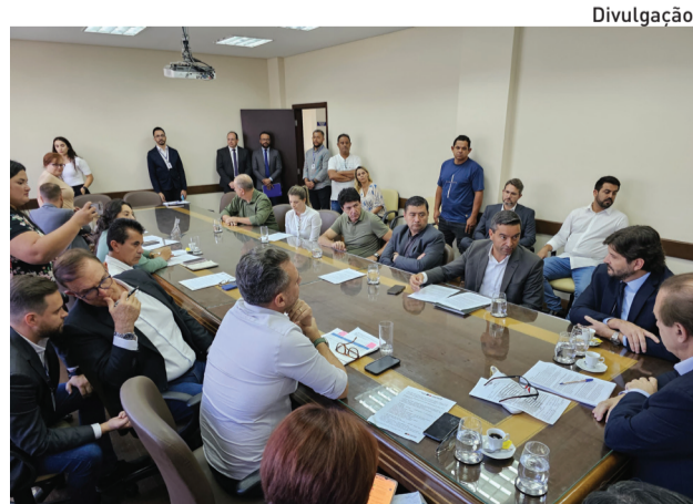
Confirmação foi dada ao prefeito pelo secretário

Durante o encontro com o secretário estadual, houve ainda as demandas apresentadas pelo consórcio regional, como a descentralização e a regionalização da Central de Regulação de Oferta de Serviços de Saúde (Cross).