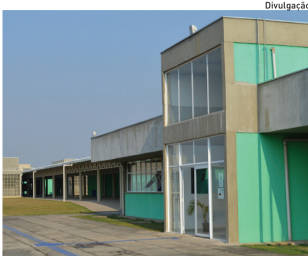
Unidade de Suzano mantém só atividades essenciais