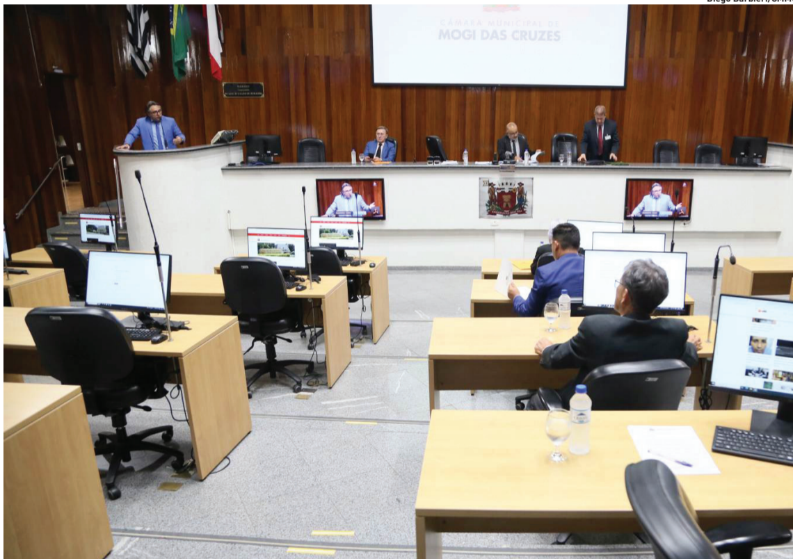
Índice foi bastante criticado pela categoria; legislação eleitoral não permite continuar negociação

A Câmara de Mogi aprovou nesta quarta (17) um reajuste de 3,15% no salário dos servidores da Prefeitura e da Câmara. A revisão anual, que rendeu um amplo debate com a categoria nos últimos meses, foi feita com base na variação do Índice de Preços ao Consumidor (IPC). Cidades, página 5