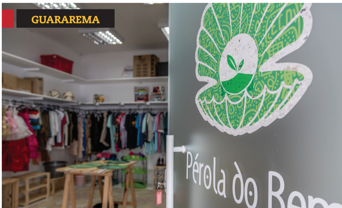
Comunicação / PMG

» Pesagem da loja Pérola do Bem volta a ser realizada. Cidades, página 3