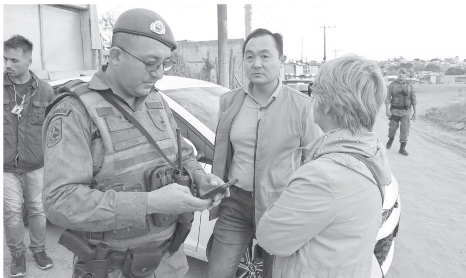
Maurício Sordilli/Suzano Suzano

A Secretaria de Meio Ambiente de Suzano e o Grupamento de Patrulha Ambiental (GPA), da Guarda Civil Municipal (CGM), interromperam na última quinta-feira (13) um crime ambiental que estava sendo praticado no rio Jaguari, situado na região norte da cidade, após flagrarem um homem, acompanhado de três auxiliares, efetuando descarte de resíduos de siderurgia com alumínio nas margens e na água. Os quatro foram conduzidos ao 2º Distrito Policial (DP) do Boa Vista.