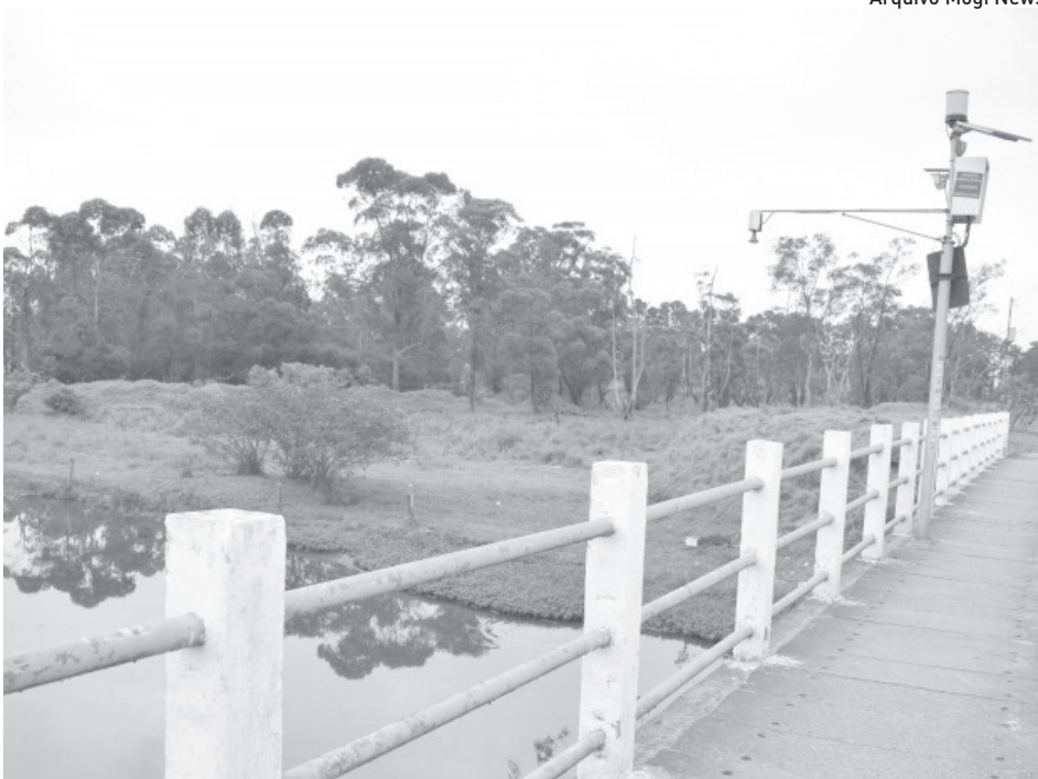
Em Suzano, qualidade da água do rio Tietê varia conforme a região da cidade

Para isso, estão previstas diversas ações, entre eles o desassoreamento do rio, construção de Polders (estruturas hidráulicas artificiais, conhecidos como diques e