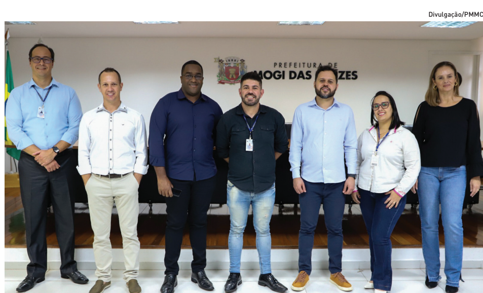
A comitiva foi liderada pelo presidente da Câmara Municipal de Varginha

“A Ouvidoria aproxima a população e a prefeitura, traz soluções e projetos mais abrangentes e representativos,