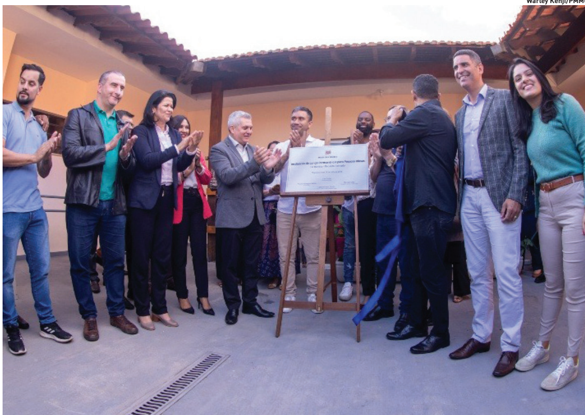
Situada no distrito de Jundiapéba, a nova unidade atenderá inicialmente 12 pessoas idosas

GUARAREMA Festival de Inverno tem shows no fim de semana.p3