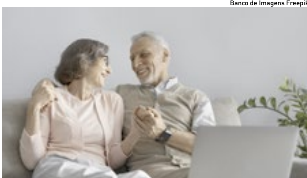
Campanhas precisam estar associadas aos contextos

Mais importante que abordar as práticas de prevenção já conhecidas, como a camisinha,