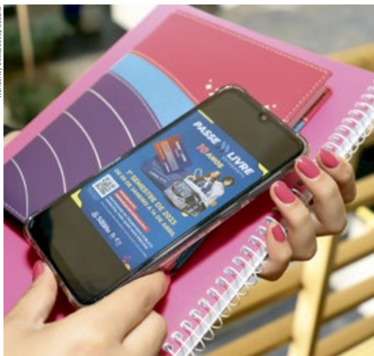
Prefeitura de Suzano abre inscrições para o "Passe Livre Estudantil" amanhã. Cidades, página 4