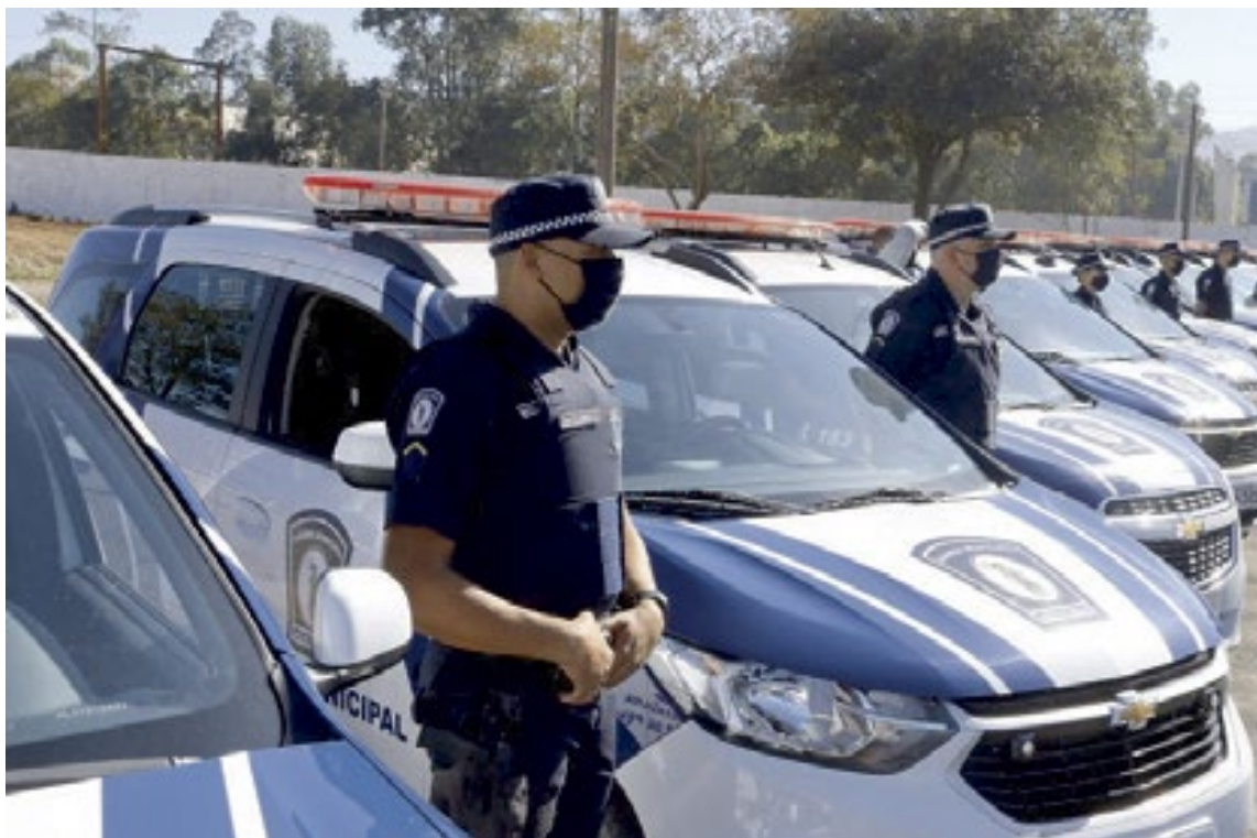
Corporação recebeu viaturas e armamentos ao longo de 2022; novas melhorias estão previstas para este ano

Administração finalizou a licitação para o Centro de Operações Integradas e prepara investimentos em tecnologia